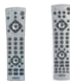
EasyControl4™ / EasyControl6™ To operate your TV and A/V devices with one remote control Art.nr. 09660 / Art.nr. 09661